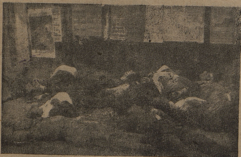
MILANO - PIAZZALE LORETO

Un incidente d'auto, fatto passare per attentato, provoca l'uccisione da parte dei tedeschi di 15 detenuti tolti dal carcere di S. Vittore. La folla che li ha piantati esposti in Piazzale Loreto a Milano, ricopre oggi di fiori la loro fossa al Cimitero.